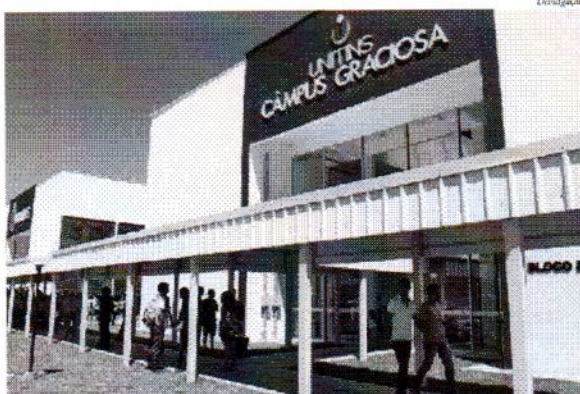
As provas serão aplicadas em 22 cidades tocantinenses.

No dia de aplicação das provas, os candidatos devem apresentar documento de identificação oficial com foto (não é permitida a apresenta-